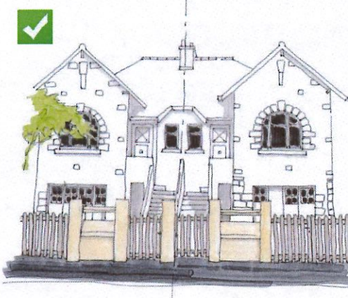
Hauteur et typologie de clôture semblable au voisinage, ici sur des maisons jumelles

Il existe trois typologies de clôtures : maçonnée, végétale ou mixte. Pour cette dernière, il s'agira alors d'un muret surmonté d'une grille ou d'éléments à claire-voie doublés de végétation.