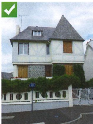
La clôture révèle l'architecture

Les éléments standardisés banalisent la clôture et empêchent le regard de circuler en créant des « murs artificiels »