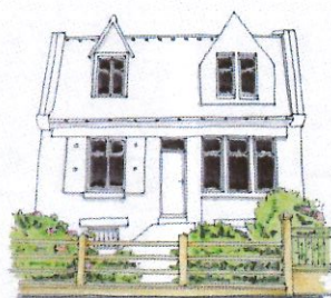
Clôture à claire voie